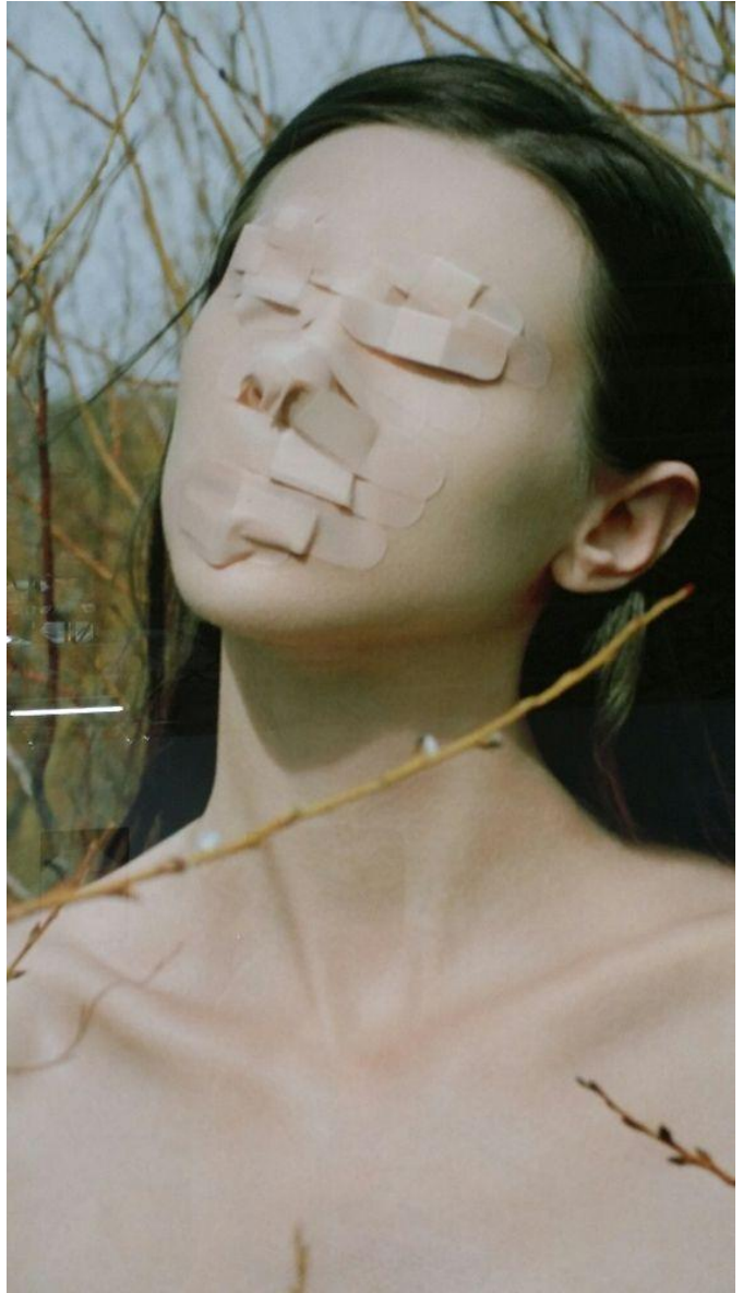
MONTE DE VENUS