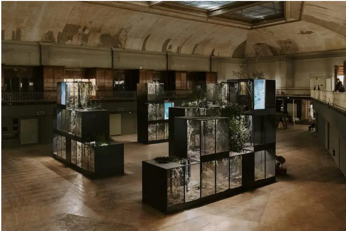
UGO SCHIAVI - GRAFTED MEMORY SYSTEM