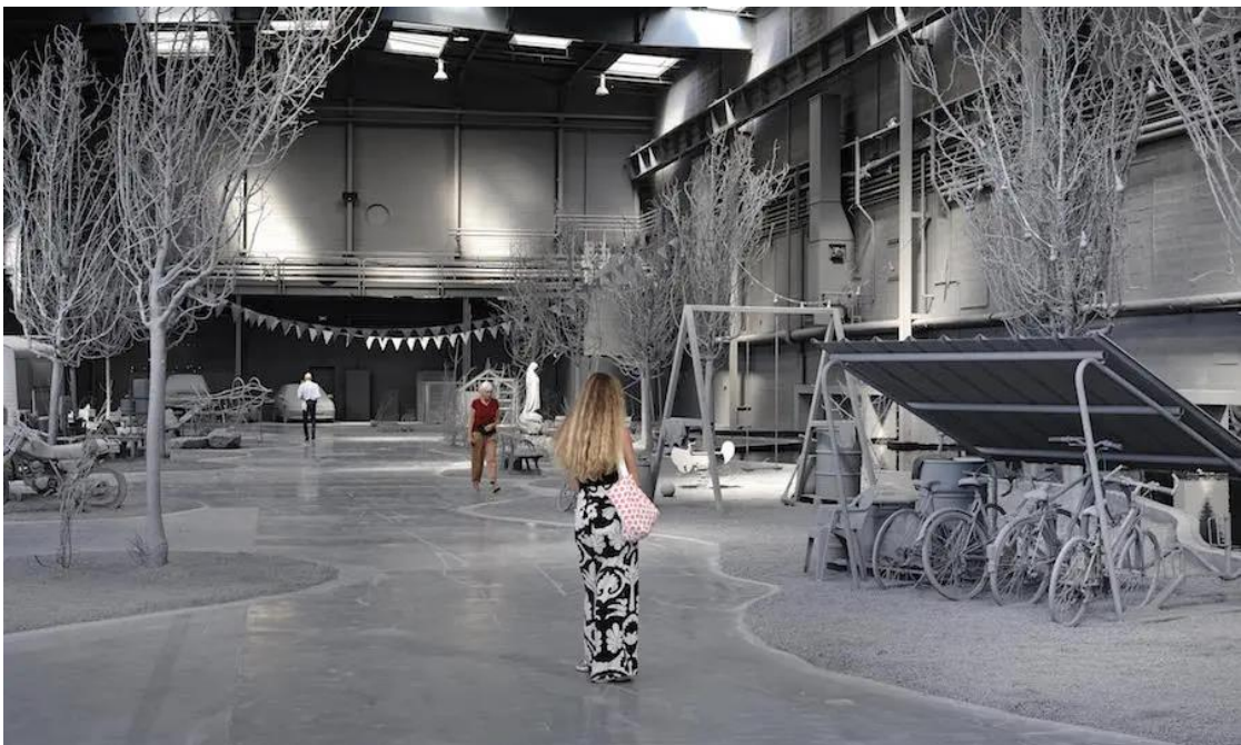
HANS OP DE BEECK WE WERE THE LAST TO STAY