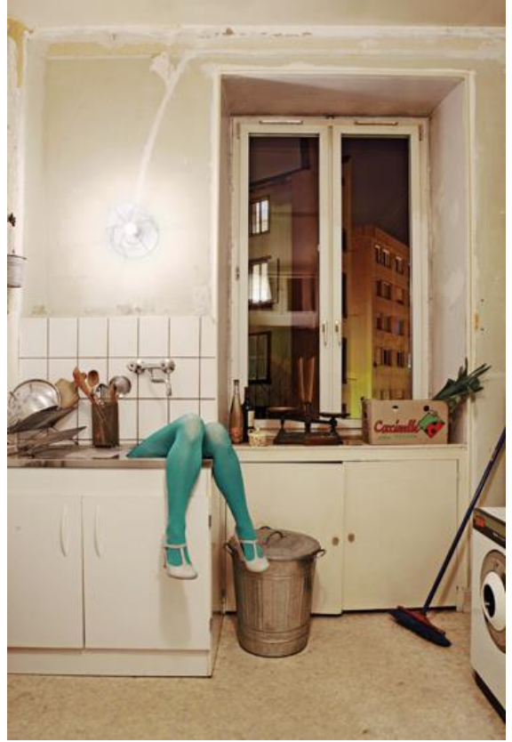
FRÉDÉRIC GABLE — DÉSENJAMBÉE