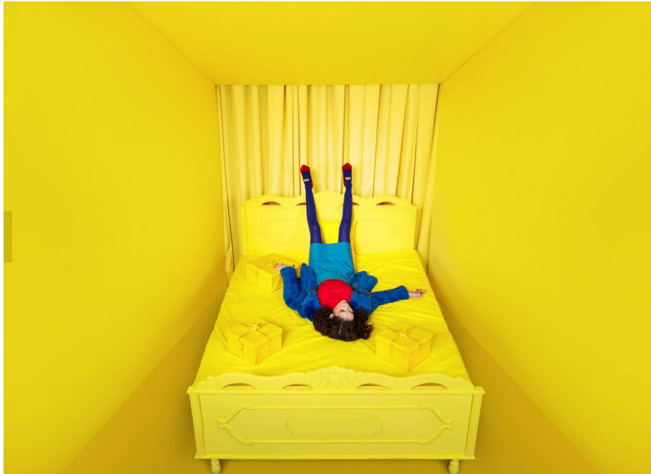
ABC DIGITAL CAMPAIGN — PLASTIK STUDIOS