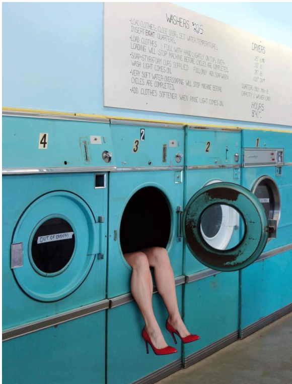
FRÉDÉRIC GABLE — DÉSENJAMBÉE