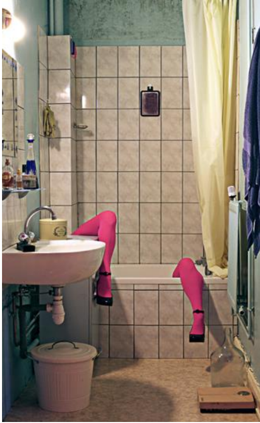
FRÉDÉRIC GABLE — DÉSENJAMBÉE